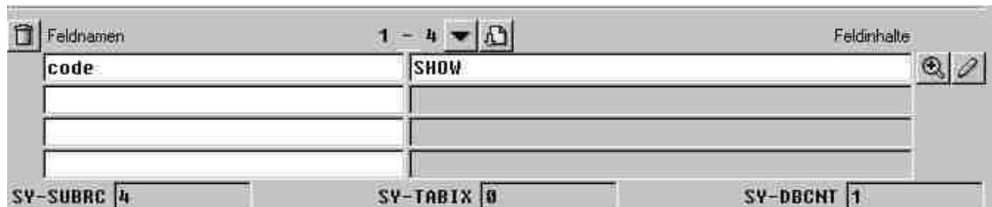
Abb. 1: Debug-Modus über /h aus SE16 heraus - code-Variable vor Umschalten in EDIT